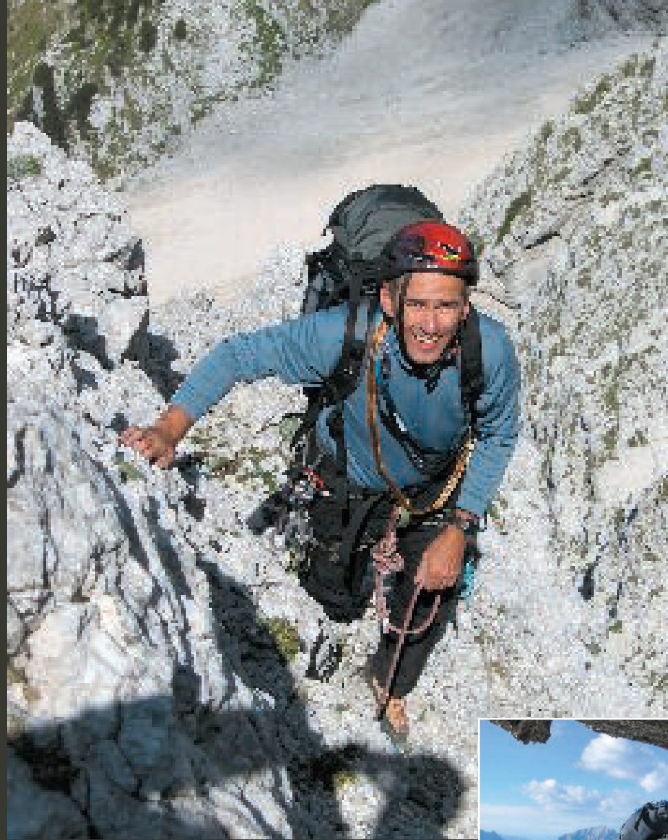
Da naš prvi minister ni od muh, sem ugotovila že po prvih metrih plezanja.

Ob pol osmih zvečer smo stali na vrhu. Čeprav smo bili samo na 2398 metrov visokem vrhu Lepe Špice, mi lahko verjamete, da sem se počutila kot na Mt. Everestu. In prepričana sem, da nisem bila edina! Toda časa za praznovanje in občudovanje sončnega zahoda ni bilo več veliko, saj se je bližala noč, nas pa